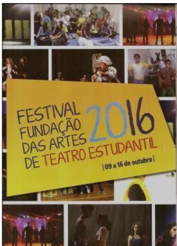
Festival Fundação das Artes de Teatro Estudantil. Edição 2016. Capa do programa

Criado pela Fundação das Artes de São Caetano do Sul em 2012 e de caráter não competitivo, o Festival Fundação das Artes de Teatro Estudantil foi pensado como um momento de encontro, reflexão e troca. Alunos e professores têm seu trabalho comentado por uma banca de profissionais convidados especialmente para oferecer um retorno crítico ao trabalho. Para tanto, o Festival tem tido o cuidado de convidar experientes profissionais das artes cênicas, que com olhar sensível, compartilham de seu saber de modo construtivo, sem alimentar competitividades e respeitando o processo artístico de cada grupo. O Festival se consolidou como um encontro de grupos estudantis e um espaço para seu fazer artístico. Realizado em parceria com a Secretaria de Cultura da cidade de São Caetano, o Festival em 2017 está na sua 6ª edição.