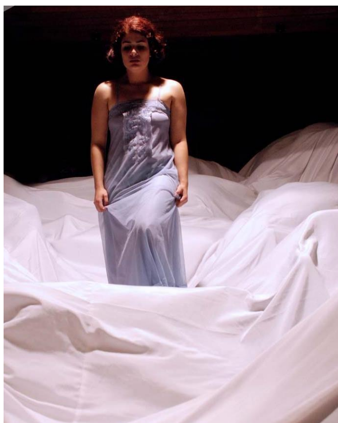
Espectáculo "Suíte 32. Direção de Melissa Aguiar Núcleo de Corpo. 2009

O Curso Técnico em Teatro exige oferece a possibilidade de que ao aluno escolha temas e componentes que se aproximem de seus interesses na escola e na inserção no Setor Cultural/Mercado de trabalho. As Práticas Artísticas, Técnicas e Experimentais serão